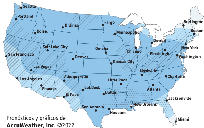
Pronósticos y gráficos de AccuWeather, Inc. ©2022