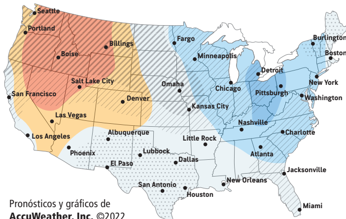
Pronósticos y gráficos de AccuWeather, Inc. ©2022