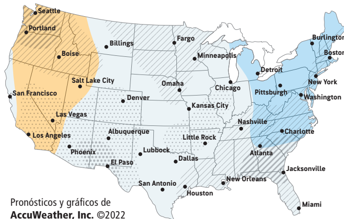
Pronósticos y gráficos de AccuWeather, Inc. ©2022