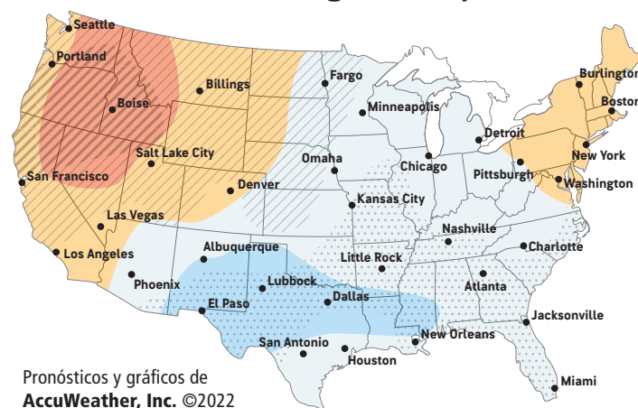
Pronósticos y gráficos de AccuWeather, Inc. ©2022