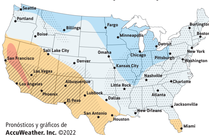
Pronósticos y gráficos de AccuWeather, Inc. ©2022