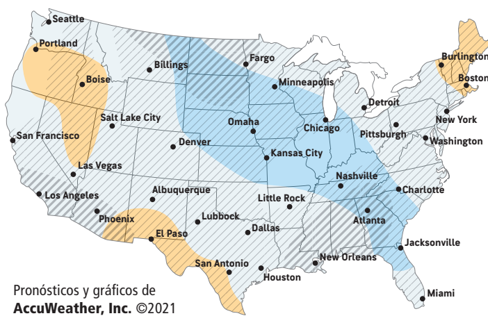
Pronósticos y gráficos de AccuWeather, Inc. ©2021