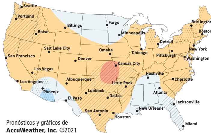
Pronósticos y gráficos de AccuWeather, Inc. ©2021