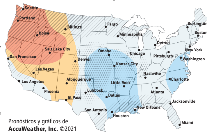
Pronósticos y gráficos de AccuWeather, Inc. ©2021